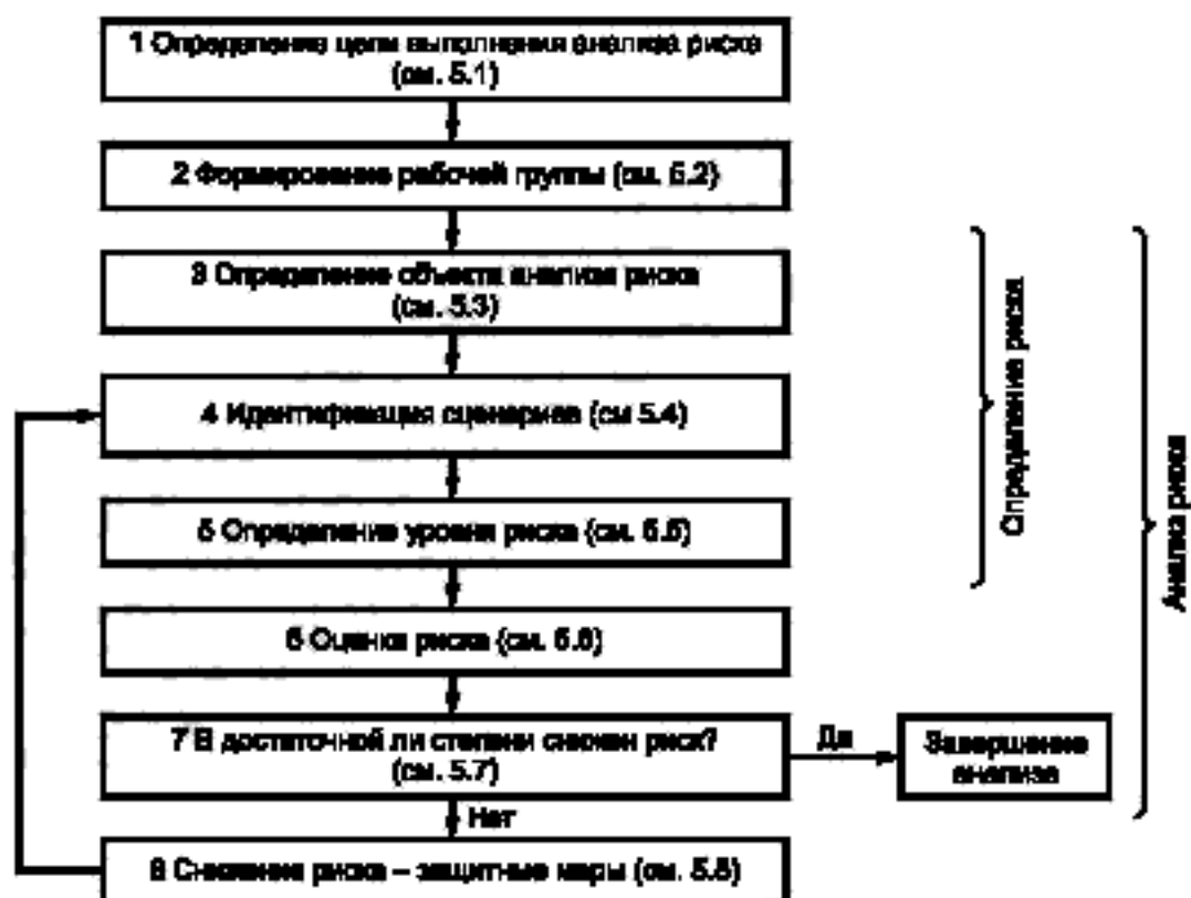
Рисунок 1 — Схема выполнения анализа и снижения риска